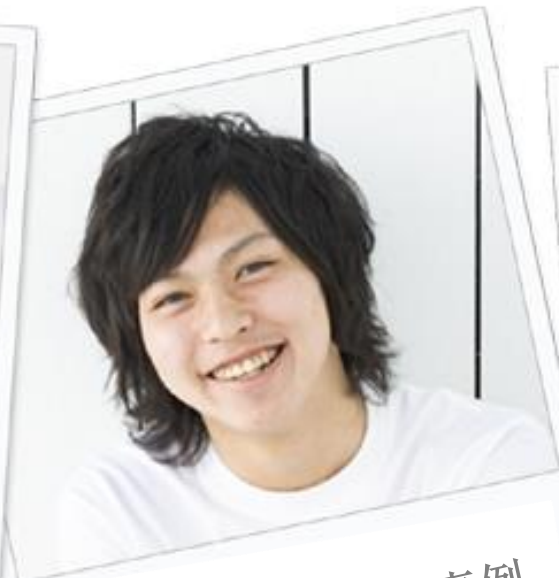
介绍员工的成功事例