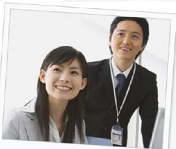
展开多样的员工活动