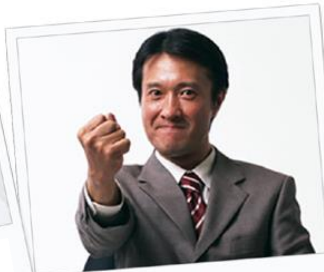
使经营者的声音直观的 渗透